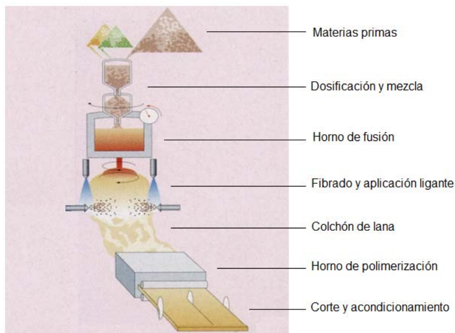
Figura 1. Proceso de fabricación del producto ULTRACOUSTIC R