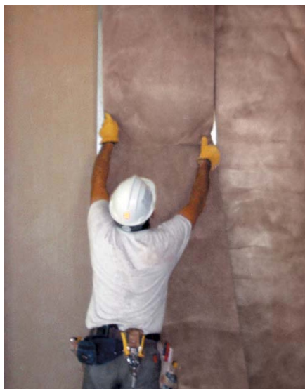
Figura 2: Solución constructiva. Instalación de ULTRACOUSTIC R en divisiones interiores a base de entramado metálico y placas de yeso laminado

Se estima que las mermas de producto generadas durante su instalación son del 2%. Además de estas mermas, se generan residuos de embalaje: madera, polietileno y papel/cartón. Se ha estimado que todos estos residuos se transportan en camión hasta un vertedero controlado situado a 50 km del lugar de la instalación.